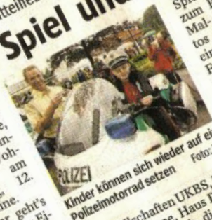
Kinder können sich wieder auf ein Polizeimotorrad setzen

Von 14 bis 18 Uhr geht's rund am Jona-Haus an der Eichenstraße. Neben Spiel und Spaß soll das Fest vor allem auch die Nachbarschaft stärken und dem Kennenlernen dienen. Auf Jung und Alt freuen sich auch das Jugendamt, der Bezirksdienst der Polizei, die Siedlergemeinschaft Ackerstraße, die Wohnungs-